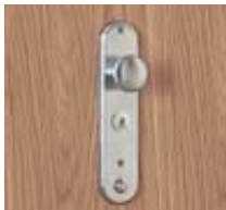
Latón cromado cepillado

Tanto para el interior como para el exterior, la elección del equipamiento le permite personalizar su puerta acorazada en función de sus gustos y de la decoración de su hogar.